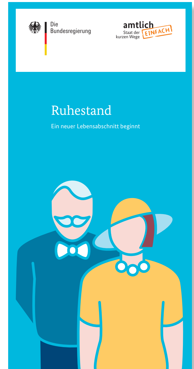
Publikationskonzept »Lebenslagen« 4 Beispiel-Flyer (Titelseiten)